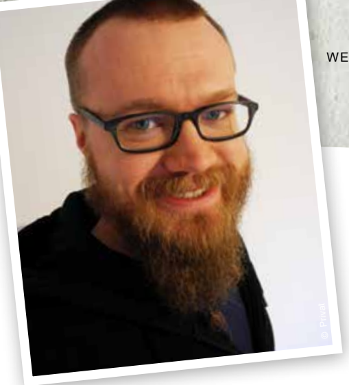
WER IST EIGENTLICH... ?